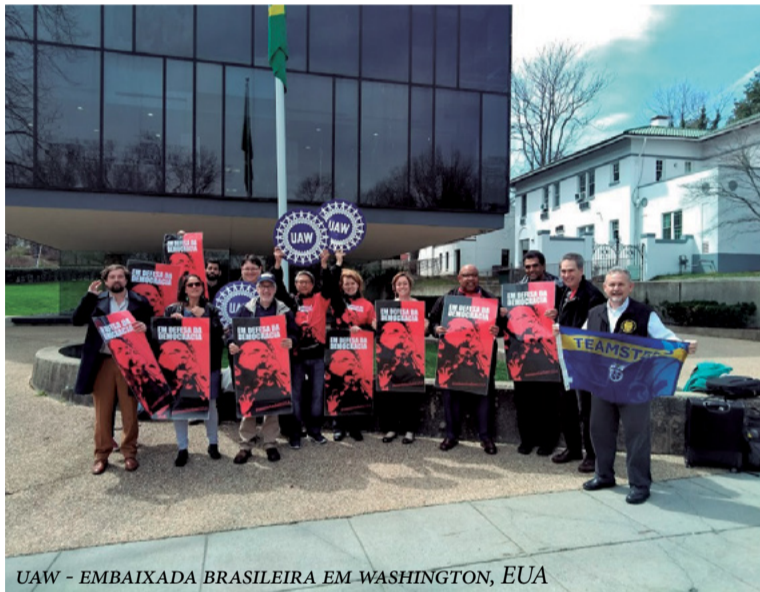
UAW - EMBAIXADA BRASILEIRA EM WASHINGTON, EUA